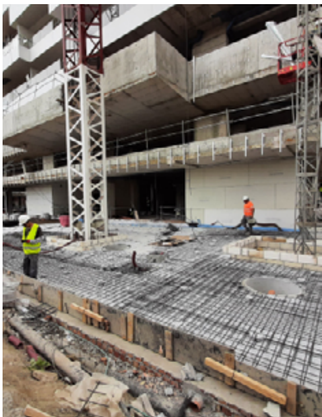
O núcleo de agregados contém tubos de drenagem para evitar a acumulação de água e possíveis sobrecargas.

O enchimento leve, com espessuras que variam de 0,8 a 1,5 m, foi fixado por dupla impermeabilização. A primeira camada, sob o agregado Arlita®, sela a laje do parque de estacionamento enquanto a segunda, em cima da laje de betão garante a drenagem e a proteção contra fugas. O núcleo de agregados contém tubos de drenagem para evitar a acumulação de água e possíveis sobrecargas na laje do parque de estacionamento.