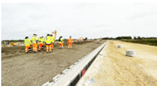
O projeto iniciado em janeiro de 2022, tem como objetivo ligar as principais vias e melhorar a fluidez do tráfego.

Produto Leca: 28.000 m 3 de agregado leve Leca® 10-20