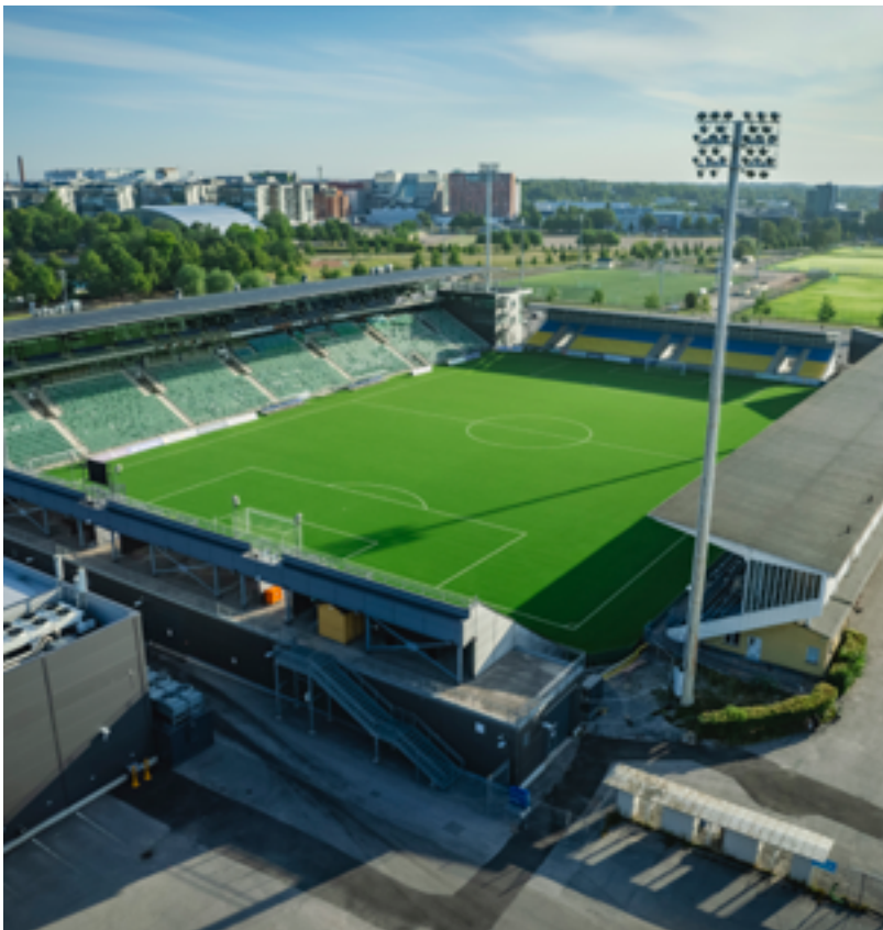
O Estádio Veritas é um estádio de futebol de padrões internacionais localizado em Turku.