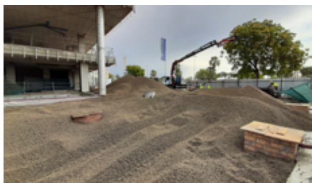
Enchimento ligeiro com espessuras que variam entre 0,8 e 1,5 m.