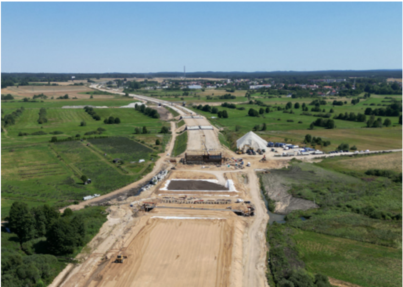
A via rápida S6 liga Szczecin a Gdańsk, no norte da Polónia.