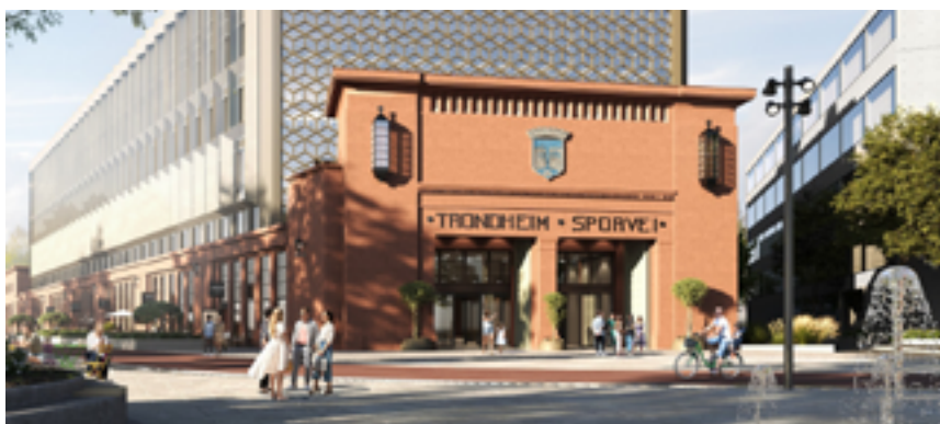
Além de ser o maior local de trabalho de escritório de Trondheim, o “Teknostallen” terá também um ginásio, lojas, restaurantes e um jardim com 3.000 m 2 envidraçado e restaurantes. (Ilustração: KLP Eiendom)