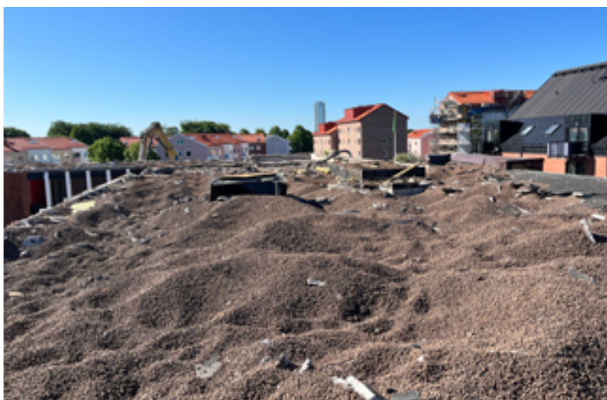
A operação envolveu dois operadores, um a segurar a mangueira de sucção e outro a retirar as peças de betão para que não fossem aspiradas.

Quando o camião de aspiração estava cheio, o motorista movia o camião apenas alguns metros para despejar o agregado leve Leca® aspirado. No total, cerca de 500 m 3 de agregado leve Leca® foram reaproveitados. Além da reutilização do agregado, os antigos tijolos dos edifícios serão reutilizados, e serão instalados painéis solares nas coberturas.