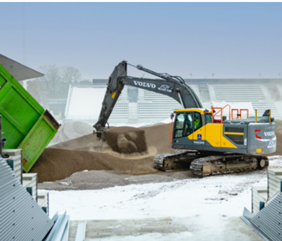
Foi adicionada uma camada de 10 a 30 cm de agregado leve Leca® sobre o antigo enchimento ligeiro.