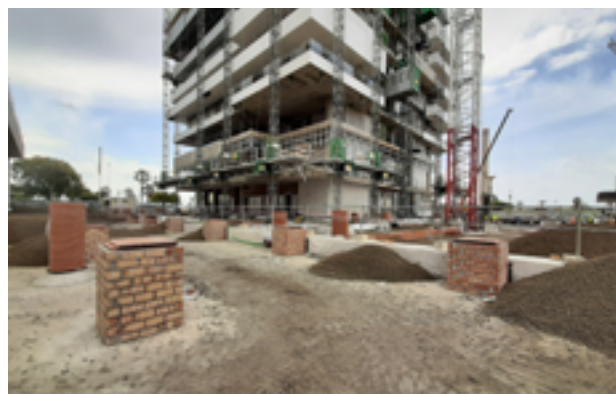
O aterro acomoda serviços como a eletricidade, água e saneamento.