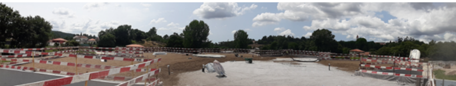
Foram aplicados cerca de 250 m 3 na cobertura do edifício através de bombagem direta.

Mais do que um simples edifício, o novo Centro de Saúde simboliza o compromisso da Câmara Municipal de Guimarães com a saúde e o bem-estar dos seus cidadãos e representa um passo significativo na melhoria do acesso a cuidados de saúde de qualidade para uma ampla comunidade.