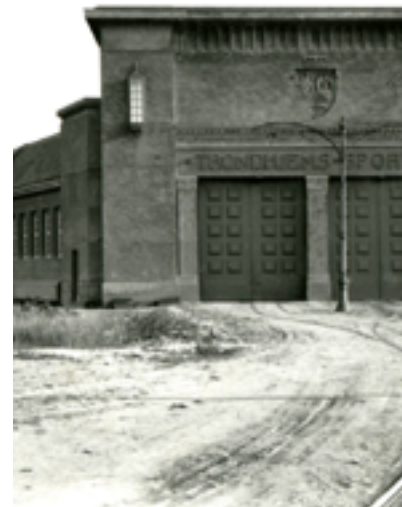
Os antigos parque de elétricos em Dalsenget, Trondheim foram construídos em 1923. Em 1956, grande parte do edifício ardeu juntamente com a maior parte do material circulante do que era então a Trondheim Sporvei