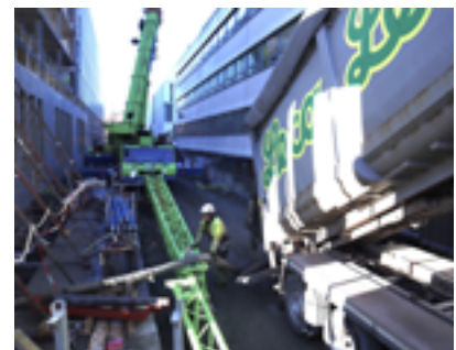
As condições apertadas no estaleiro de obras não são obstáculo quando o enchimento pode ser bombeado pneumaticamente para o seu lugar com longas mangueiras

Uma parte fundamental do novo centro de tecnologia e inovação de Trondheim é o antigo depósito de elétricos de 1923, projetado pelo arquiteto Hagbarth Schytte Berg, conhecido pelas suas obras de Arte Nova em Trondheim.