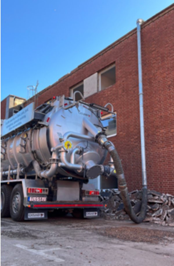
O camião foi facilmente instalado ao lado do prédio.