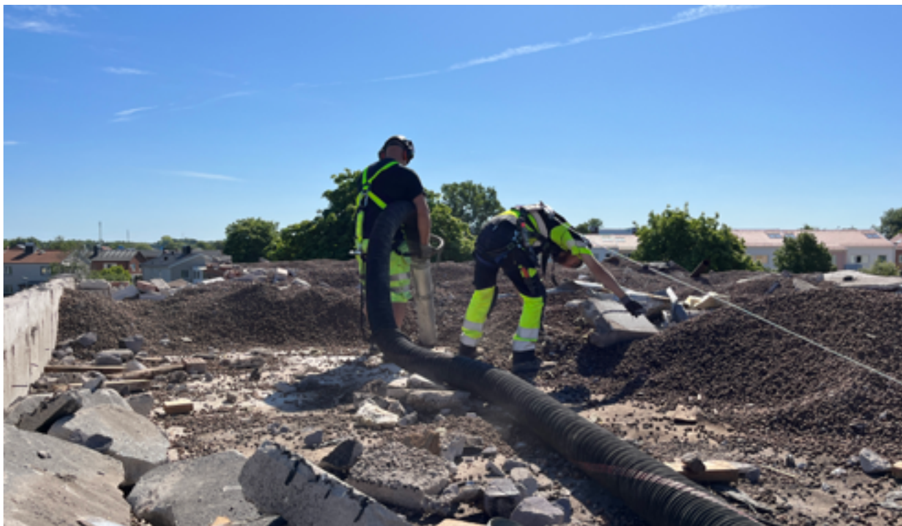
O agregado leve na cobertura dos anos 60 foi analisado e pode ser reutilizado.