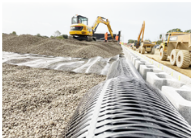
A inovação encontra a infraestrutura: a sinergia do agregado leve Leca® e do sistema de rede tensora em Spalding.

O transporte direto de agregado leve Leca® a partir de um local a menos de 16 quilómetros de distância reduziu a necessidade de utilização intensiva de camiões.