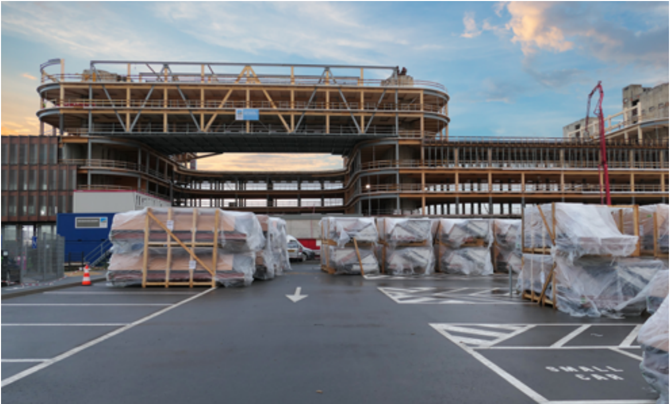
O Centro de Negócios Skypark no Aeroporto do Luxemburgo é atualmente a maior construção em madeira da Europa