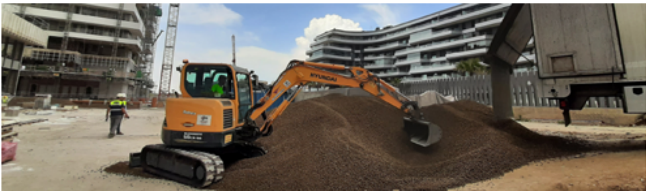
O agregado Arlita® reduziu o número de camiões necessários - diminuindo a pegada de CO 2

Málaga é uma das mais belas cidades de Espanha e tem vindo a sofrer uma rápida transformação. Este projeto deverá tornar-se numa nova referência para uma vida de elevada qualidade – incluindo apartamentos com preços até 3,5 milhões de euros. O gabinete Estudio Lamela Arquitectos está empenhado em fornecer um produto de elevada qualidade, privilegiando a sustentabilidade e o respeito pelo ambiente.