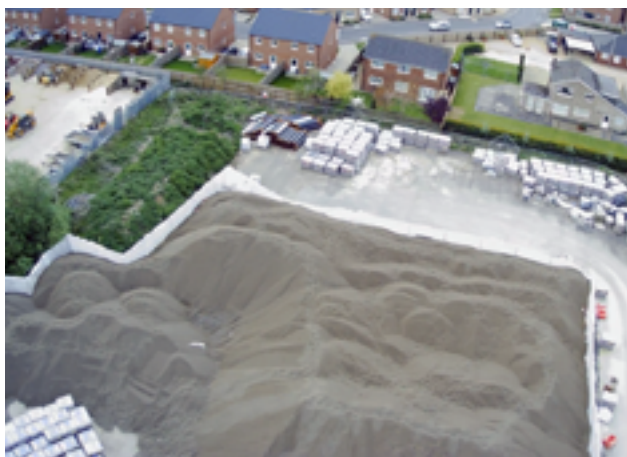
O projeto minimizou o impacto ambiental obtendo o agregado leve Leca a partir de um local a menos de 16 quilómetros de distância.