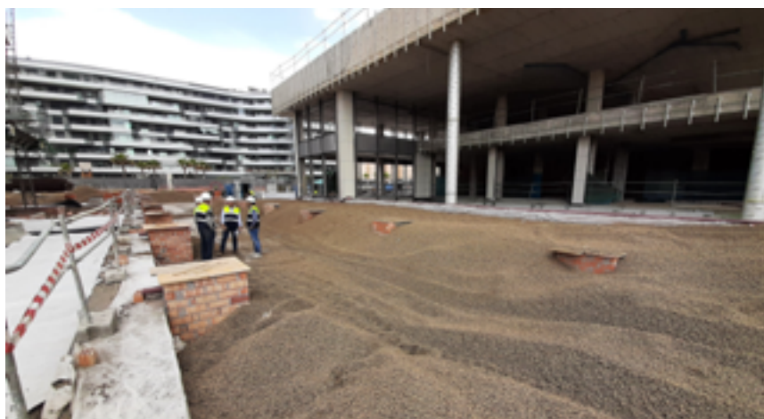
O núcleo de agregado Arlita contém tubos de drenagem para evitar a acumulação de água e possíveis sobrecargas.

A SACYR Construcción S.A. liderou o projeto de construção e exigiu um enchimento diário de 600 a 700 m 3 . Esta abordagem inovadora reduziu significativamente o número de camiões necessários, diminuindo a pegada de CO 2 e melhorando a qualidade do ar. O processo de compactação foi realizado em camadas de um metro, utilizando equipamentos de rastros de 6 toneladas. Esta técnica eficiente permite alcançar o desempenho necessário do projeto com um único equipamento, demonstrando a eficácia e sustentabilidade das operações da SACYR.