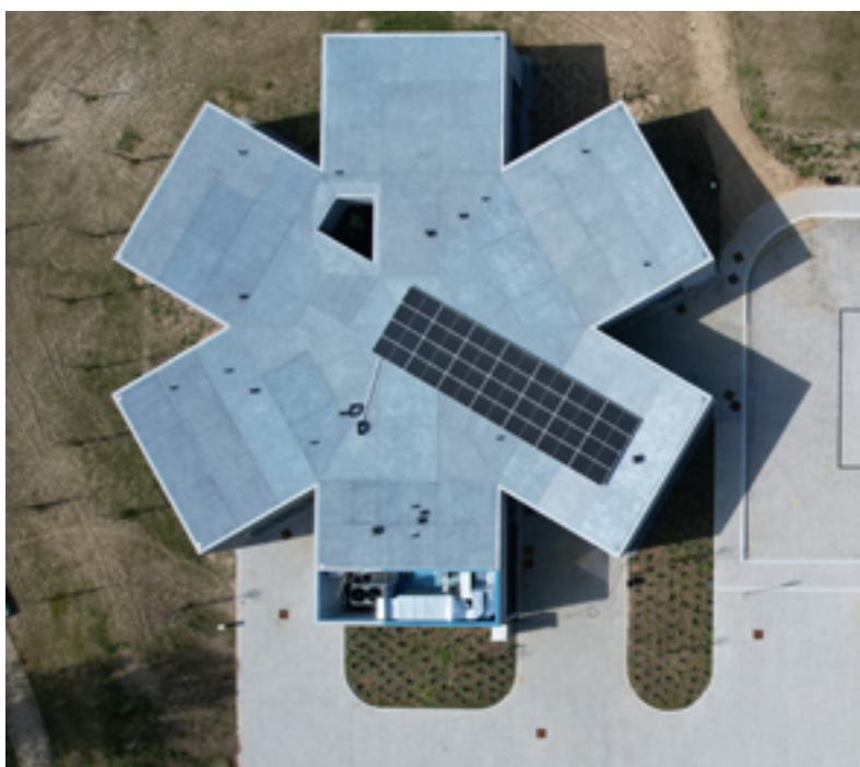
A arquitetura em forma de estrela do centro, inspirada na estrela da vida de seis pontas