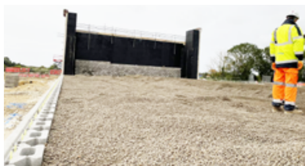
O uso de agregado leve Leca® em áreas com más condições do solo perto de cursos de água provou melhorar a estabilidade do solo.